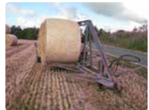
Rundballer hælder mod rækværk i midten.

til øverste halmballe. Dvs. bøjlen skal nå mindst halvt op på halmballen.