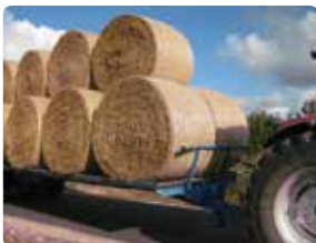
Sikker transport af rundballer med lille rækværk ved enderne.