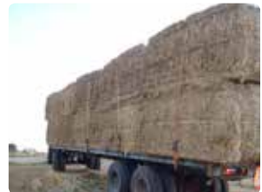
Bigballerne er fastspændt med stropper over alle ballerne.