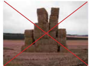
Minibigballe i mark. De øverste kan vælte ned.