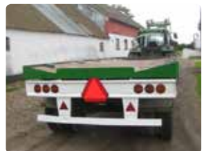
En halmtransportvogn er bedst, hvis ladet hælde mod midten.