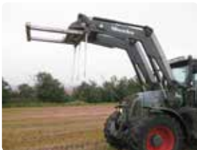
Ved kørsel med halmspyd skal læseren være hævet i øverste stilling.

Under transport skal man sikre sig god synlighed i forhold til medtrafikanter.