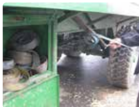
Stropper og opruller lige ved hånden.