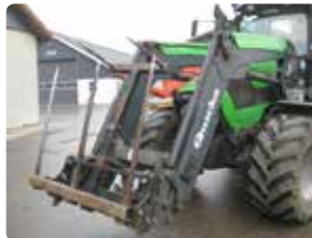
Det nederste spyd er slået op i transportstilling.