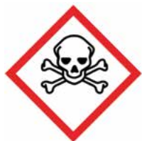
AKUT GIFTIG (FARLIGE)